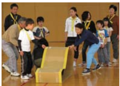
段ボールキャタピラリレー