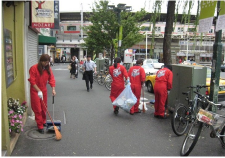
統一美化デーの様子

7月20日、統一美化デーを、住区住民会議と自由が丘商店街振興組合の共同主催で行いました。区後援の他、多数の団体・学校等のご協力、作業及び違法放置物調査を済ませることができました。街のあらこちらで、自宅前を清掃されている方々も見受けられ、街全体の美化という理想形に近づいてきたことを実感しました。来年は、熱中症対策を熟慮の上、開催日時を決定します。環境整備委員会