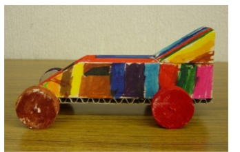
スポーツカー (工作ランド作品)

容器包装リサイクル法で牛乳パックの回収が義務づけられている。そこで製紙会社に訊ねてみた。牛乳パックは上質なパルプでできているため、パック6枚で1個のトレットペーパーができるという。