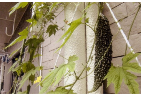
ゴーヤの料理教室の様子