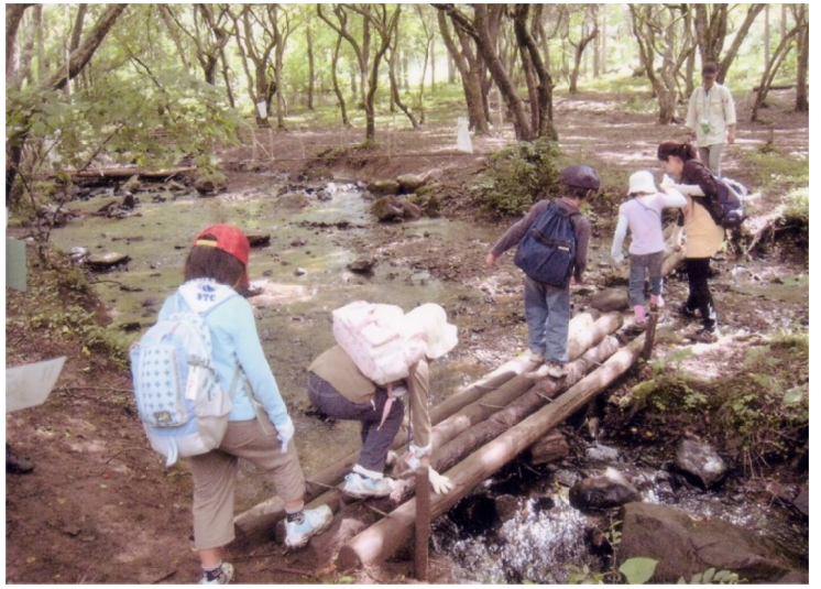
地図を片手に森の中を歩くオリエンテーリング

7月25〜27日の日程で国立信州高速青少年自然の家へ行ってまいりました。総勢64名の参加がありました。このキャンプは区内の小学校の児童・先生・地域住民がオリエンテーリングなどのさまざまな行事を通して交流しあう場となっています。朝は16℃ほどとても快適でした。キャンプファイヤーへの道ではホルタルの姿も見られたり自然を満喫できました。不安定な天候の中、すべての行事を行うことができ、事故や体調の変化もなく安全で楽しいキャンプができたのではとっております。