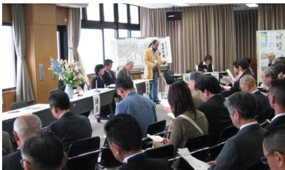
平成20年度住民会議役職者