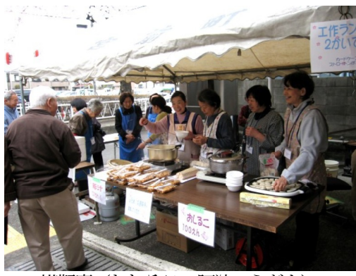
模擬店 (おしるこ、豚汁、うどん)

3月30日(日)10時より、宮前分室前の香川遊歩道沿いで宮前町会・自由が丘町会の協力のもと恒例の「みやまえ・桜まつり」が行われました。 今年は好天に恵まれ、桜もほほ満開となり、人通りも多く、模擬店も早々と完売しました。区長や来賓も多数見えました。六百人ほどの大賑わいでした。 分室内の「工作ランド」や「いこいの家」の輪投げも子どもたちの人気のもとでした。「桜まつり」は5回目を迎えすっかり定着してきたようです。 桜まつり実行委員会